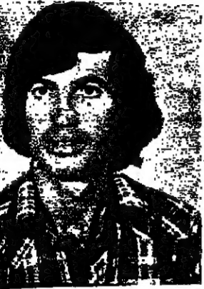
صحي بشناق لاعب شفا عمرو الدنابسا

من الدكتور رضا شورا .. على ملعب طيرات كرميل .. التي فريق مكابي الفريديس مع مكابي زخرون يعقوب .. جرت المباراة في جو كانت الاعصاب متوترة مما ادت الى توترات غير محقة وضربات طائفة .. فوزي يهودا